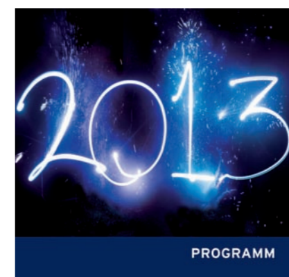
„Regional verwurzelt - international erfolgreich“ heißt es 2013 beim MC.

4. Juni: „Simplify your life“ ist die erfolgreiche Buchserie von Tiki Küstenmacher. Beim MC-Clubabend gibt der Autor und Journalist Tipps für die einfache, eigene Entfaltung