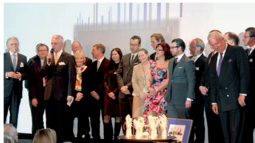
Teamarbeit: Zum Abschluss standen der MC-Beirat und das TRILUX-Siegerteam gemeinsam auf der großen Bühne.

Arnsberger Unternehmen perfekt in das diesjährige Suchfeld für den Marketing-Preis: „Regional verwurzelt - international erfolgreich“. Die Preisskulptur wurde traditionell von Arwed Fritsch entworfen, Künstler und Ehrenmitglied des Marketing-Clubs. Mit viel Kreativität hatte er die Skulptur mit den acht Händen entworfen und individuell auf TRILUX zugeschnitten. Dabei wurde er technisch von dem Hagener Unternehmer „Schilder Schulz“ unterstützt. Unter lautem Applaus der Gäste nahm das TRILUX-Team den Preis entgegen.