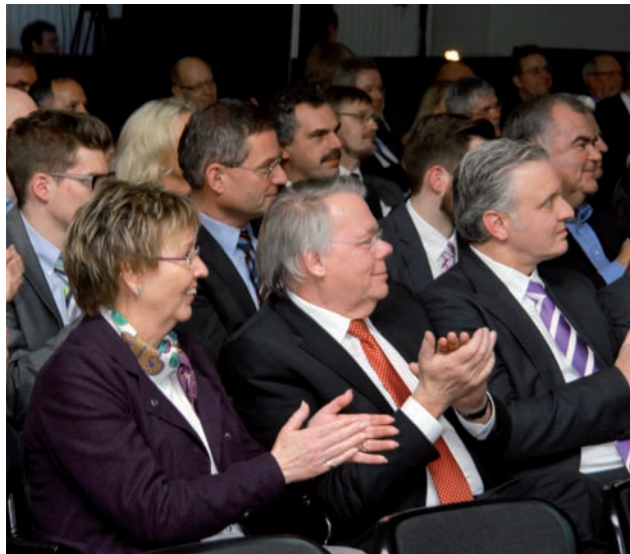
Rund 300 Besucher beglückwünschten den Preisträger im großen Hörsaal der SIHK zu Hagen.