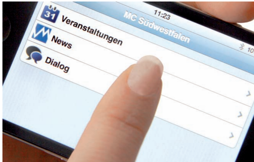
Über die neue MC-App sind alle Termine auch immer auf dem Handy dabei.

Bewerbungsunterlagen für die Firmenmitgliedschaft gibt es im Clubsekretariat sowie zum Download auf der MC-Homepage unter www.mc-suedwestfalen.de .