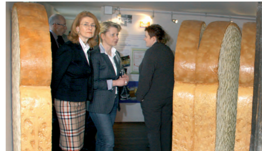
Zwischen lebensgroßen Zwieback-Scheiben wurde der Gang durch das Zwiebackmuseum zum echten Brandt-Markenerlebnis.