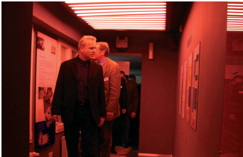
Heiße Infos: Der Weg durch die museale Zwieback-Produktion führttauch geradewegs durch die Rösterei, wo sich die MC-Mitglieder unter der Hitze der Heizstäbe mit Infos eindecken konnten.

Brandt aus Hagen? Aber natürlich: Über 70 Mitarbeiter arbeiten inzwi-