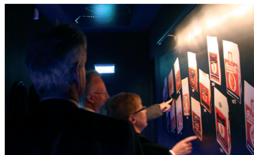
Sternegucken à la Brandt im begehbaren Innern der Verpackung: Im Schein des Zwieback-Himmels wird der Blick auf die verschiedenen Verpackungen im Laufe der Jahre gerichtet.

So waren die MC-Besucher beim Rundgang durch das Erlebnismuseum überrascht von den vielen bekannten Markennamen im Brandt-Geschäftsumfeld.