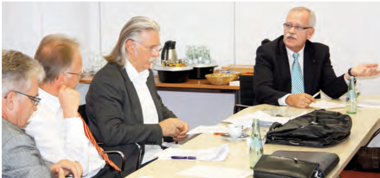
Die Jury-Mitglieder haben es sich nicht leicht gemacht: Alle Vorschläge wurden begutachtet und diskutiert. Die Unternehmen, die es in die Endrunde geschafft haben, wurden bereits besucht und noch einmal ganz genau unter die Lupe genommen, ob sie die Kriterien auch erfüllen.