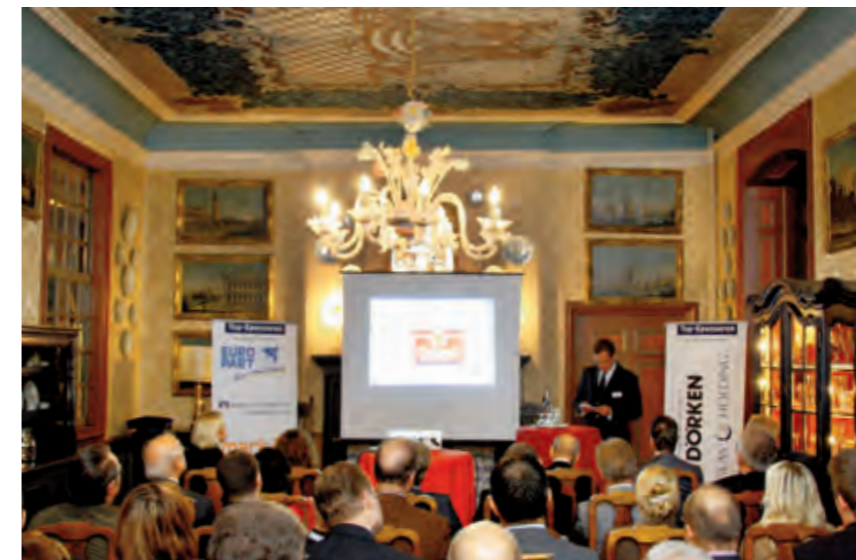
Die Besucher des Clubabends waren begeistert von dem stilvollen Ambiente auf Schloss Wocklum, das unter anderem Austragungsort von international bedeutenden Reitturnieren ist.