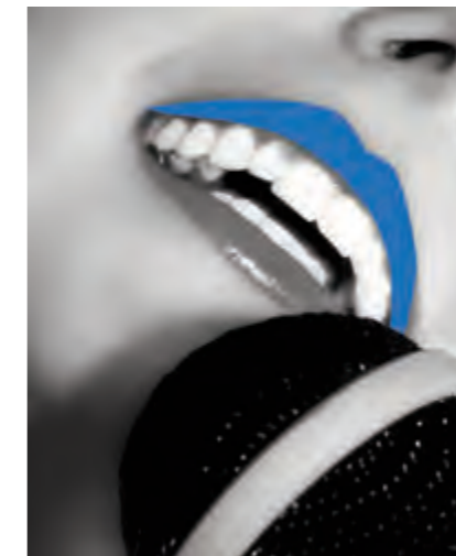
Bei der Club-Session wird Marketing zum Kunststück.

überraschenden und erlebnisreichen Abend. Denn vier Hagener Künstler werden uns auf ganz unterschiedliche Weise und in verschiedenen Disziplinen der Kunst inspirieren und einladen, Marketing einmal ganz anders anzugehen und mit zu gestalten. Freuen dürfen wir uns auch auf die Verwöhmomente für unsere Geschmacksnerven. Ein Highlight am Anfang der Session ist bestimmt die Verleihung des 3. Wissenspreises. Vor und hinter die Kulissen dieses würdigen Preisträgers zu schauen, wird jeden aus der Region interessieren.