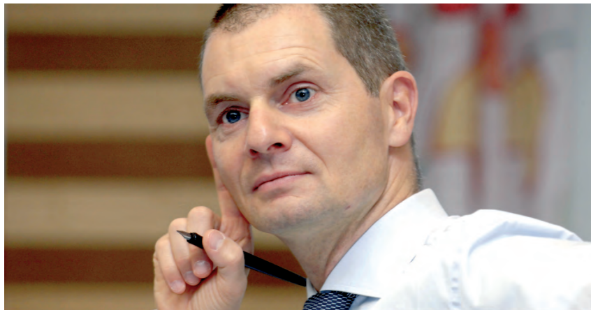
Dirk Kreuter gibt am 2. September Tipps für das aktive Empfehlungsmarketing.

Durch die ständige Reizüberflutung im Alltag, wird es immer schwieriger gerade im B2B neue Kunden zu erreichen. Die etablierten Wege zum potenziellen Neukunden sind ausgetreten. Was können Sie tun? - Antworten gibt es beim nächsten Clubabend am Dienstag, 2. September, von Dirk Kreuter.