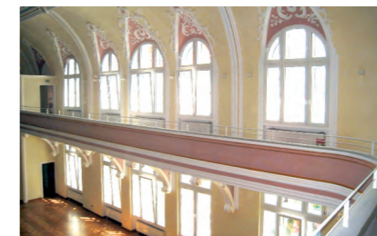
Beim Gala-Abend wird in der Schauburg auf zwei Ebenen gefeiert.