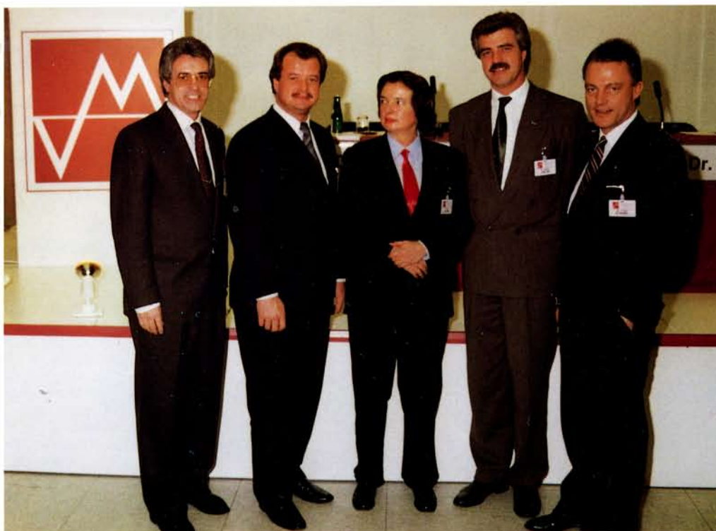
Diese fünf Unternehmer stehen dem Marketing-Club Hagen vor

„Wenn zwei Menschen jeweils einen Dollar in der Tasche haben und sie tauschen ihr Geld, hat jeder anschließend wieder einen Dollar. Wenn zwei Menschen aber jeweils eine gute Idee haben und sie tauschen sie aus, hat jeder anschließend zwei gute Ideen.“